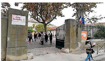
Un nouveau dossier est à remplir sur le site de la Ville.